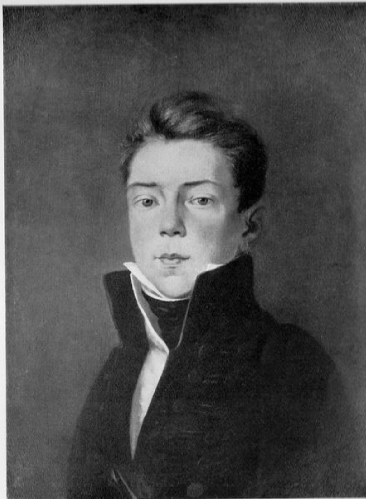
Hendrik Stephanus van Son, 1796—1853, olieverf op paneel, schilder onbekend, 1815.